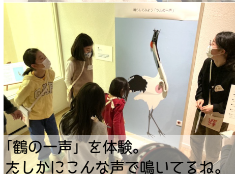
「鶴の一声」を体験。たしかにこんな声で鳴いてるね。