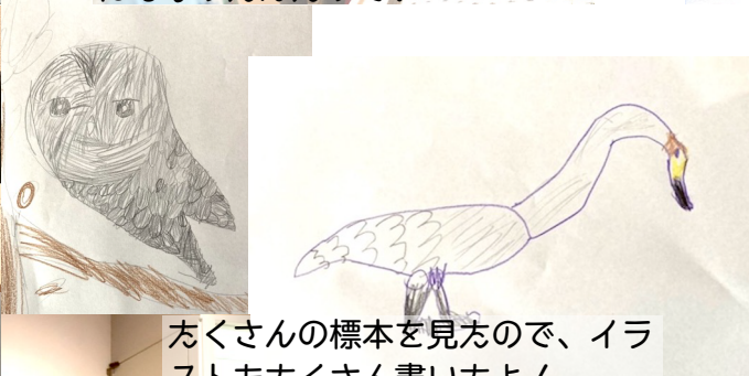
たくさんさんの標本を見方ので、イラストもたくさん書いたよ!