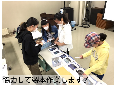
協力して製本作業します!

今日は「びとごま 30号」と「コレクションカード」の印刷が完了! まずはみんなで30号の折り込み作業とカードの製本作業を頑張って、ついに完成しました。 びとごまは2012年7月に第1号が発行されて、10年目の活動に入っています。これからも楽しくね!