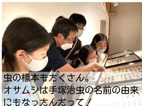
虫の標本もたくさん。オサムシは手塚治虫の名前の由来にもなったんだって!