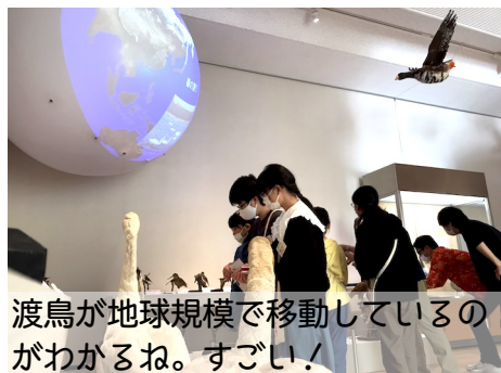
渡鳥が地球規模で移動しているのがわかるね。すごい!