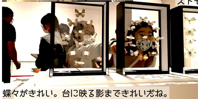
蝶々がきれい。台に映る影まできれいだね。